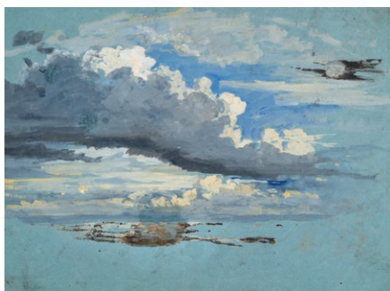
17. Lotz Károly: Felhőtanulmány, 1870-es évek akvarell, papír, 288 x 399 mm