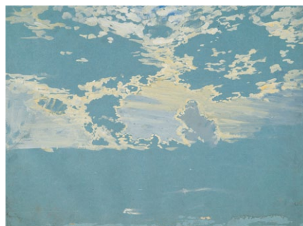
18. Lotz Károly: Felhőtanulmány, 1870-es évek akvarell, papír, 307 x 425 mm

a vízfestés levegűsebb technikája is oka lehetett, hogy ezek a művek eltávolodtak a romantika felfogásától és már az új természetfelfogást jelzik. Lotz csakúgy mint a tájképfestők többsége átengedte magát a természeti jelenség látványának és az akvarell technika előnyeinek. Az egyik Felhőtanulmány még jelzi a táj jelenlétét, a kép alsó sávjában még egy rétet fákkal szegélyezű sávot látunk, de felette már sötét és világos felhők kavargása látható. /15. kép/ Van azonban három olyan Felhőtanulmány is amelyeken már a felhők a fűszereplők. /16., 17. és 18. kép/. Az elsőt az égbolt teljes egészét beborító sötét-világos színekre hangolt felhűzetet látunk, amelynek megjelenítése erősen kapcsolódik a természeti jelenséghez és a friss természetlátáshoz, éppúgy