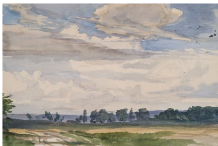
15. Lotz Károly: Felhőtanulmány, 1870-es évek akvarell, papír, 162 x 242 mm