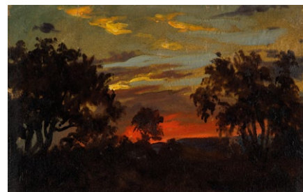
5. Székely Bertalan: Alkonyati táj, 1890-es évek olaj, karton, 265 x 427 mm