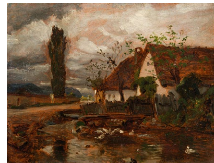
2. Székely Bertalan: Tájképvázlat, 1880-as évek olaj, papír, 29 x 39 cm