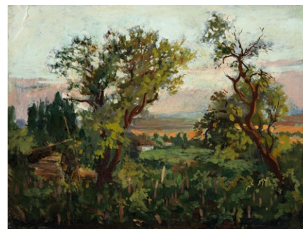
1. Székely Bertalan: Tájkép, 1880-as évek olaj, karton, 35 x 45 cm