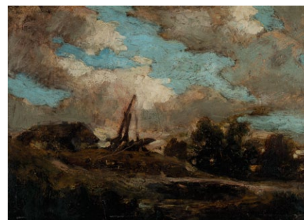
7. Székely Bertalan: Faluvége kútágassal, 1890-es évek olaj, papír, 308 x 436 mm