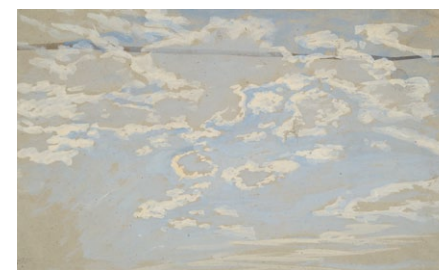
20. Lotz Károly: Felhőtanulmány, 1870-es évek tempera, papír, 195 x 302 mm