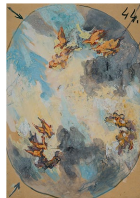
12. Székely Bertalan: Mennyezetvázlat, 1899 tempera, papír, 608 x 436 mm