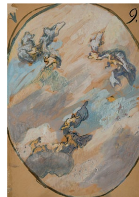
14. Székely Bertalan: Mennyezetvázlat, 1899 tempera, papír, 610 x 432 mm

Bécsben maradt és Kalrl Rahl professzor egyike legkedvesebb tanítványaként számos bécsi középület díszítésében vett részt. Ez alatt az idő alatt többször látogatott haza Magyarországra, szabadidejében valószínűleg nosztalgiából. A 60-as évektől számos olyan tájképet és életképet ismerünk amelyek a magyar Alföld tájait és lakóit ábrázolják. Ezek némelyikén a felhűk komoly szerepet kapnak a hangulat érzékeltetésében így a Betyár, vagy a Ménes a Zivatarban c. műveken. Ezt követően 1864-es hazatérése után tájképekkel már nem nagyon foglalkozott, legalábbis az olajfestmények formájában. A 70-es évektől kezdve azonban egyre több tájat ábrázoló akvarellt látunk az életműben, amelyeket festőbarátja és sógora Jakobey Károly megyeri villájának környékén készített. E kapcsolat a későbbiekben még szorosabbá vált, mert Jakobey Károly halála után elvette feleségül özvegyét, Ónodi Annát és később adoptálta Jakobey három gyermekét is. A családnál tett látogatásai során egyre többet festetett a környéken, különösen a Rákos patak és a palotai erdő vidéke ihlette meg alkotó fantáziáját. Az itt készült akvarelleken a korábbi idillikus hangulatot friss tájszemlélet váltja fel amely a táj közvetlen tanulmányozását, a valóságos tájélmény hatását feltételezi. Valószínűleg