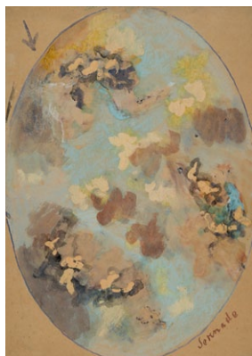
10. Székely Bertalan: Serenade, mennyezetvázlat, 1899 tempera, papír, 610 x 432 mm