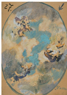
11. Székely Bertalan: Vihar, mennyezetvázlat, 1899 tempera, papír, 605 x 434 mm

racionális gondolkodással megállapított elméletnek művészi demonstrációi.” 18 A felhűtanulmányok nem csak külön akvarell illetve olajfestmény formában jelennek meg az életműben, hanem fríztervekként is, ezek pár centis csíkok, egymás fölött olykor három négy sávban és így még jobban kitónik a lényeg, hogy ezek mozgás és formatanulmányok és már nem sok közülük van magához a természethez és a természeti jelenségekhez, vagyis éppúgy absztrakciók, mint a Goethe idejében élt művészek munkái.