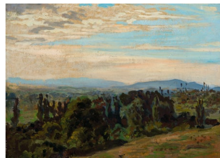
3. Székely Bertalan: Szadai vűlgy, 1880-as évek olaj, papír, 33 x 43 cm