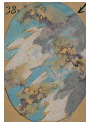
13. Székely Bertalan: Mennyezetvázlat, 1899 tempera, papír, 605 x 432 mm