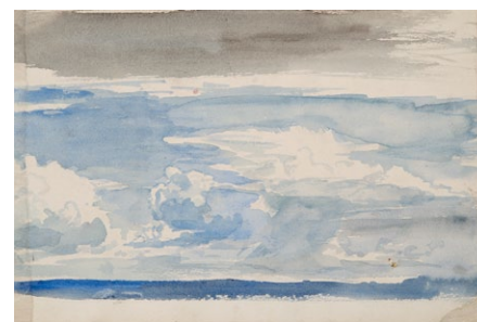
21. Lotz Károly: Felhőtanulmány, 1870-es évek akvarell, papír, 160 x 242 mm