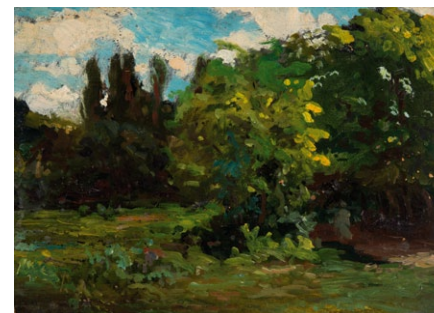
6. Székely Bertalan: Erdeti táj, 1890-es évek olaj, papír, 323 x 422 mm