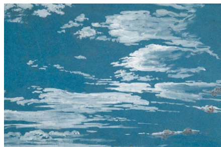
16. Lotz Károly: Felhőtanulmány, 1870-es évek akvarell, papír, 243 x 395 mm