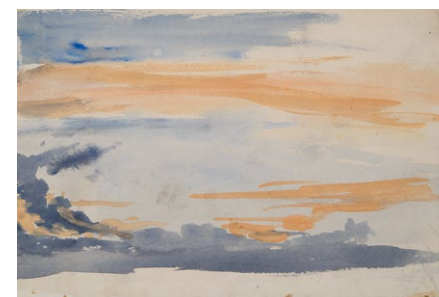
22. Lotz Károly: Felhőtanulmány, 1870-es évek akvarell, papír, 157 x 243 mm