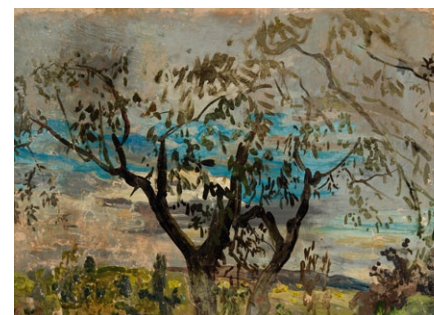
8. Székely Bertalan: Fatanulmány, 1890-es évek olaj, papír, 282 x 400 mm

tarkított kék égbolt látványával. / 8. kép / Az életműben található néhány olyan Felhűtanulmány is amelyeken a táj már csak jelzűszerű, mindűssze egy horizontális sáv és az egész képteret fehér és szürke felhűk borítják, amelyek azonban már kűzelebb állnak Székely mozgás – és formakísérleteihez, mint a táj által kűzvetített spontán tájélményhez.