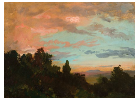
4. Székely Bertalan: Felhűtanulmány, 1890-es évek olaj, papír, 33 x 44 cm

a Szadai vűlgy is, amely az elűtérben levű erdűsávval kezdűdik és a háttér kissé magasabb dombvonulatával végűdik. / 3. kép / Felette azonban ott a kép felsű részét elfoglalű égbolt, amelynek alsű része – barnás rózsaszűnes szűneivel – az elűtér domboldalával harmonizál, míg a felette levű égszűnkék sáv – amely a kép széle felé egyre erűteljesebb lesz – a magasabb dombvonulat szűnvilágát tűkrűzi vissza. Végűl legfelűl az erdűsáv sűtűtebb szűnfoltjait láthatjuk viszont a kép bal felsű részében levű, változatos alakzatokkal tarkított felhűk sávűjában. Minden festű érthetű módon nagyon kedvelte az alkonyati égbolt látványát, hiszen a lemenű nap pazar szűnjátékkal ajándékozta meg nészűjét.