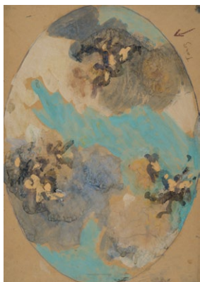
9. Székely Bertalan: Tánc, mennyezetvázlat, 1899 tempera, papír, 610 x 431 mm